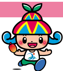
宮古島市イメージキャラクター 「みーや」