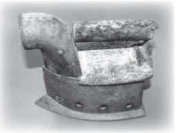
炭を入れて使用していたアイロン

博物館では、8日(金)まで「平成23・24年度新収蔵品展」を開催しております。市民の皆様からご提供いただいた、貴重な資料を展示しております。現在は不用に思っても、博物館の資料として研究し調査することで、再び大事な役割を果たしてくれるモノもございます。ぜひ、皆様の身の回りに眠っている不用品等がございましたら、博物館までご一報ください。